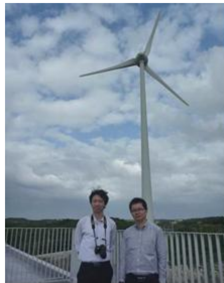
宮古島メガソーラー実証試験設備 訪問